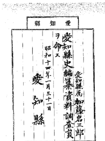
図2 辞令<加藤家文書> (愛知県公文書館蔵)

なお、『愛知縣史』②は第二次世界大戦の最中に刊行されており、刊行後も県所蔵の簿冊等は戦火を免れるために疎開するなど、大変な状況下に置かれていたことがわかります。 11