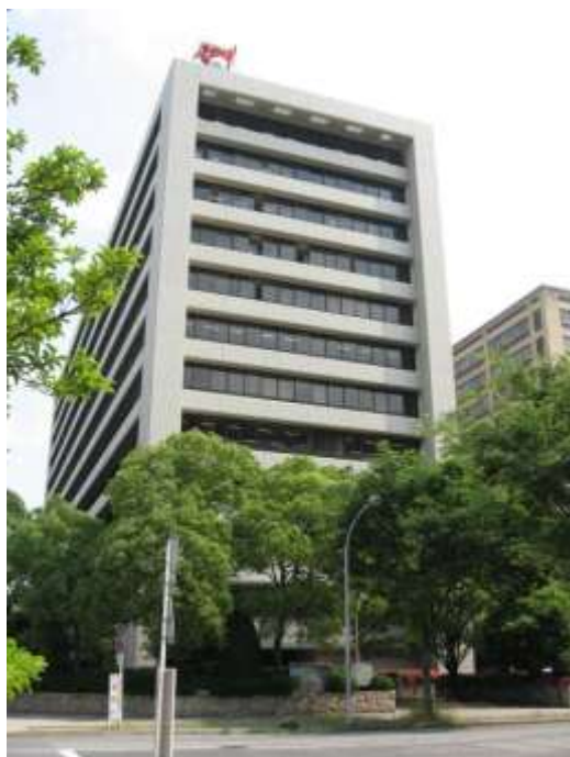
愛知県自治センター

愛知県公文書館では、これらの機関に所蔵されている愛知県庁文書（徳川林政史研究所所蔵「旧名古屋税務監督局所蔵史料」を含む。）を全てマイクロフィルムで撮影し、複製本を作成して利用に供している。