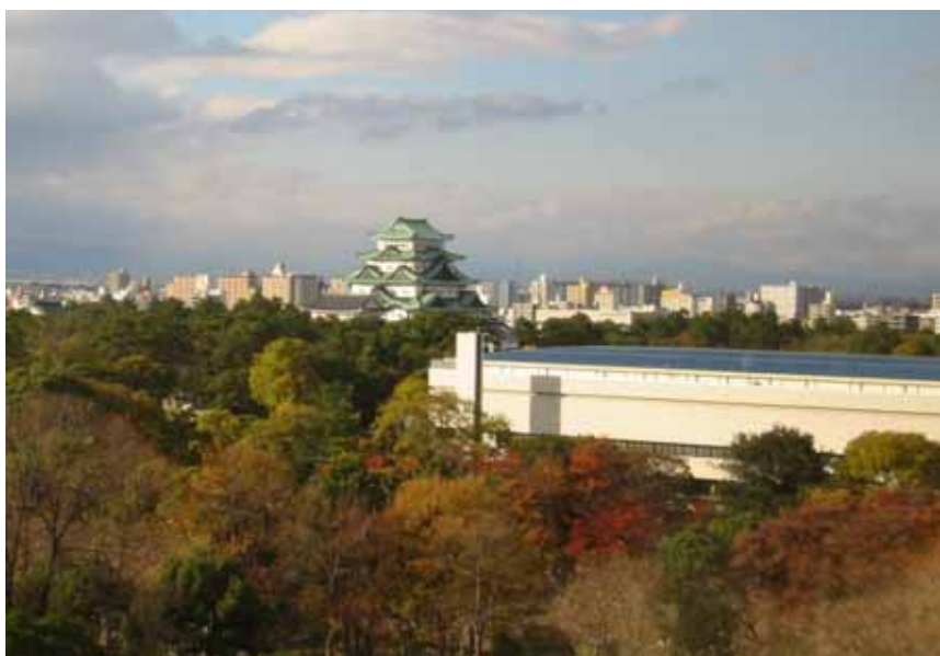
公文書館の窓から名古屋城を望む

本県では、公文書館設置に際し、これらの機関に所蔵されている県庁文書(徳川林政史研究所所蔵「旧名古屋税務監督局所蔵史料」を含む。)を全てマイクロフィルムで撮影し、複製本を作成して利用できるようにした。