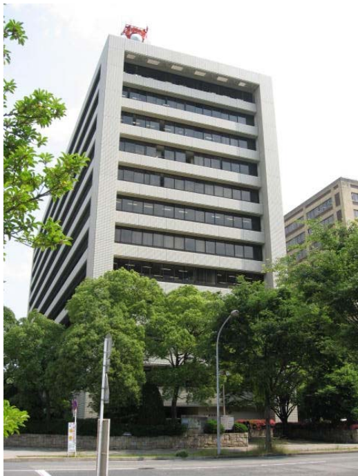
愛知県自治センター

本県では、公文書館設置に際し、これらの機関に所蔵されている県庁文書（徳川林政史研究所所蔵「旧名古屋税務監督局所蔵史料」を含む。）を全てマイクロフィルムで撮影し、複製本を作成して利用できるようにした。