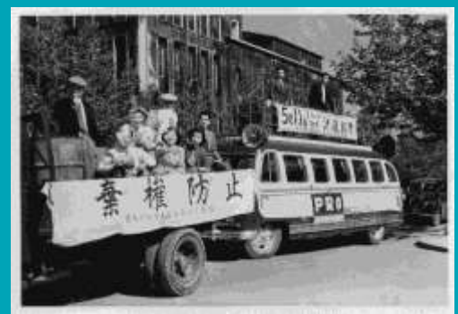
知事選決選投票の棄権防止を訴える県のPR車