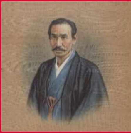
歴代愛知県知事肖像画・写真 (初代愛知県権令 井関 盛良)