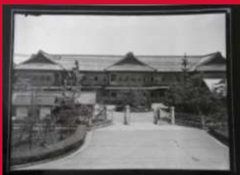
愛知県庁舎等の写真(南武平町の県庁舎)

ご覧になった皆様が、本館所蔵資料を通して、愛知県の歴史に一層興味を持っていただければ幸いです。