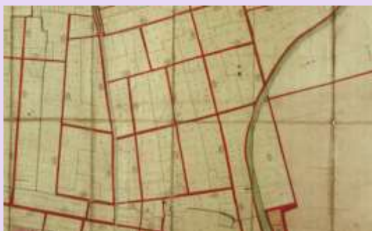
地籍図 名古屋区 天

地籍図は、明治17年に作成された地図で、原則1村が1枚の和紙に1200分の1の縮尺で記載されています。右の地籍図は、現在の名古屋城近辺のもので、その大きさは、縦200cm×横340cmにもなります。