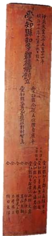
愛知県知多郡役所棟札

そこで、今回の特別展では、普段は複製でしか閲覧ができない貴重な資料の原本や初公開の資料を数多く展示します。また、文字資料に限らず、絵図や写真など、当時の愛知の姿を伝える資料を幅広く紹介します。