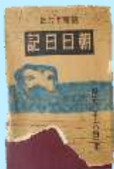
寄託資料 加藤鏖五郎関係資料 日記

加藤鏖五郎は、瀬戸市出身の愛知県を代表する政党政治家で、昭和33年には衆議院議長に就任しています。