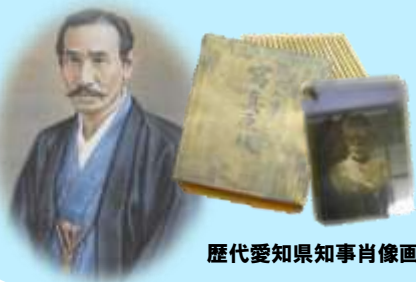
歴代愛知県知事肖像画・写真

左の肖像画の人物は、愛知県権令の井関盛長（いせきもりとめ）です。権令とは現在の知事にあたるため、井関盛長が初代の愛知県知事に相当します。