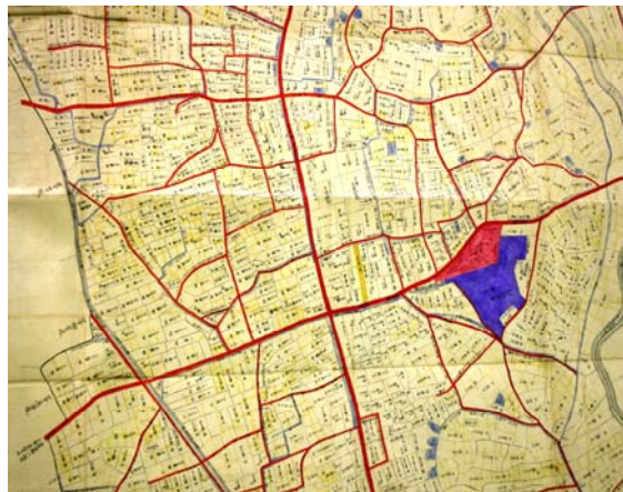
碧海郡 八ツ橋村〔地籍図〕

足助(現在の豊田市)の名所と幡豆郡横須賀村(現在の西尾市)の名所が印刷されている絵はがきです。史跡・名勝、町の様子などが載っています。