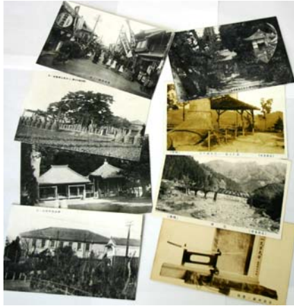
足助・横須賀村名所絵葉書 〔刊行物〕

足助(現在の豊田市)の名所と幡豆郡横須賀村(現在の西尾市)の名所が印刷されている絵はがきです。史跡・名勝、町の様子などが載っています。