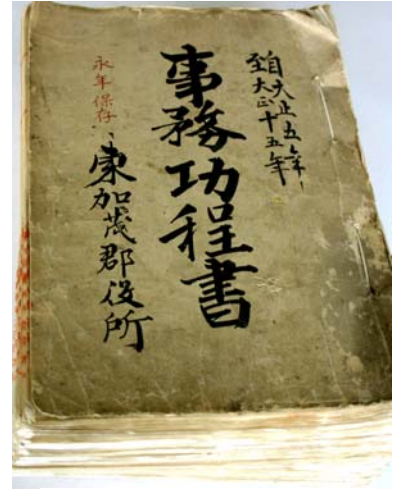
事務功程書 〔郡役所文書〕

地籍図(地籍字分全図)とは、明治十七年に作成された地図で、原則一村が一枚の和紙に、千二百分の一の縮尺で記載されています。上記の地籍図は現在の知立市八橋町のものです。