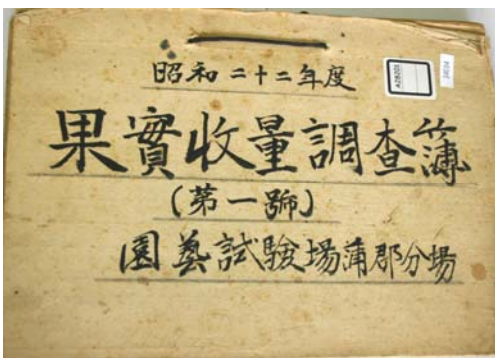
果実収量調査簿(第1号) 〔公文書〕

東加茂郡役所で作成された資料で、大正五年から大正十五年までの文書が綴じられています。中には町村費や県税、米の収穫高などの事務内容が書かれています。