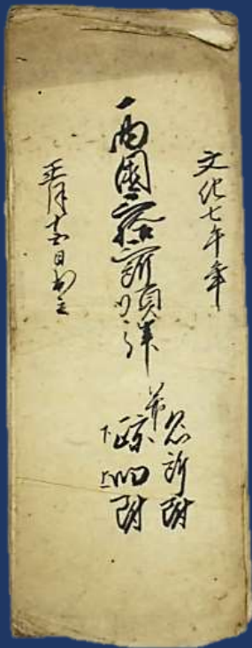
西国三拾三所順拝 並名所附旧跡附