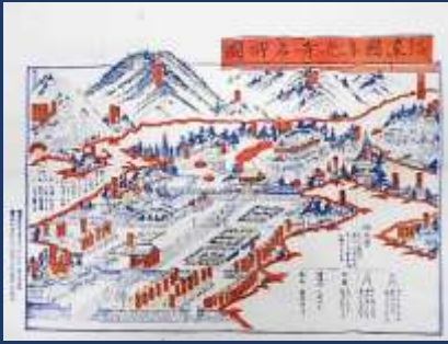
信濃国善光寺名所図

見ているだけで旅をした気分になれるような絵図や、旅人の巡った名所の記録などに加え、名所の維持・管理にかかわる公文書についてもご紹介します。