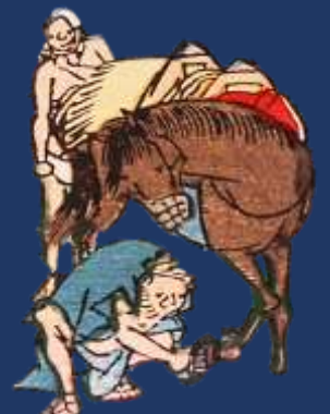
安藤広重筆 東海道五十三次 [狂歌入り]より 一部

交通 地下鉄名城線「市役所」駅下車 5番出口より徒歩1分 電話 052-954-6025 住所 名古屋市中区三の丸2-3-2 愛知県自治センター7階 URL http://www.pref.aichi.jp/kobunshokan/