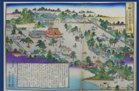
「古社寺及著名ノ社寺ニ関スル調査書」より 葉栗郡曼陀羅寺図面